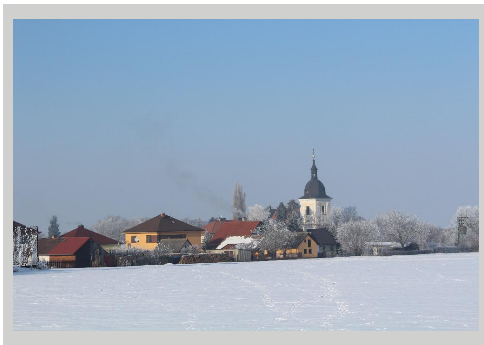
Zimní Dobřenice

Jsme také kontaktním centrem pro občany a organizace působící na našem území, jako jsou školy, hasiči, sportovci apod. Na našich webových stránkách přinášíme aktuality pro občany, které se týkají běžných povinností každého z nás, aktualizujeme informace v části veřejných služeb a zveřejňujeme pozvánky na společenské a sportovní akce v obcích. Aktivitu, které pro naše obce vykonáváme, jsou nejen námi, ale i starosty obcí vnímány velmi pozitivně. Práce s Vámi nás těší, a proto se na společnou spolupráci, i nadále těší tým Centra společných služeb.